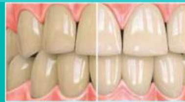
RELATIVE DENTIN ABRASION (RDA)*

Премахва повърхностните петна за изсветляване на зъбите до два нюанса само за един месец! 1